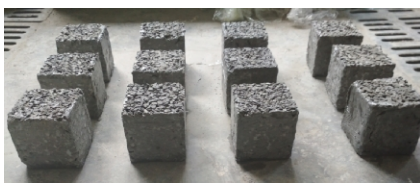
图2 水泥浆封边后的试件

初秋的那个下午,儿子去图书馆借了曹文轩老师写的《萤火虫》。这回儿子给为娘的下了任务,“妈,这本书我读完之后,你也一定要好好看。”也是的,我一直要求孩子们有空要多看书,在我有意无意的引导下,两孩对看书倒是比较喜欢的,由此渐渐地在家藏得各式各样的书也越来越多。说来惭愧的却是自己,心里也想陪着孩子们一起多看看书,但结果次次都是翻几页,或开头或页尾或其中,翻个大概看下大致内容而已,能完整一本看下来的却是微乎其微。